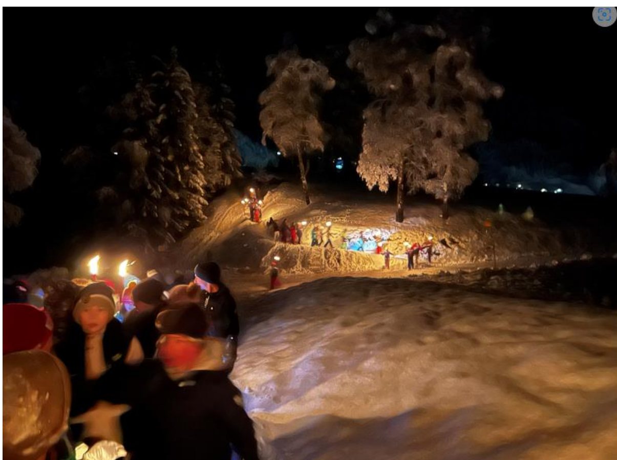
Januar 2025: Fackelwanderung während dem Schneesportlager in Disentis